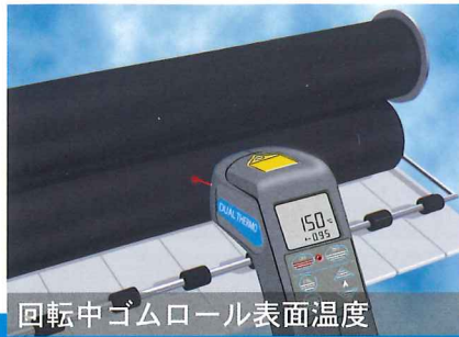
回転中ゴムロール表面温度