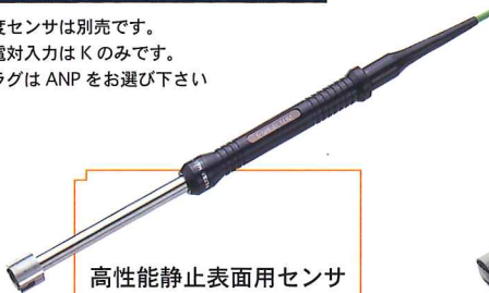
高性能静止表面用センサ S-121K-01-1-TC1-ANP 希望小売価格 65,000 円