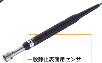
一般静止表面用センサ A-231K-00-1-TC1-ANP 希望小売価格 19,500 円