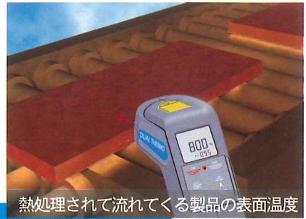
熱処理されて流れてくる製品の表面温度