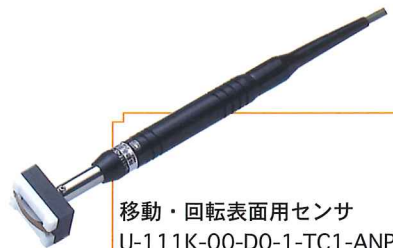
移動・回転表面用センサ U-111K-00-D0-1-TC1-ANP 希望小売価格 22,500 円