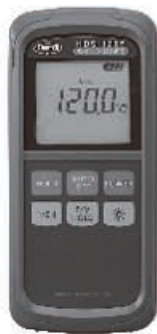
スタンダードモデル HDS-120E