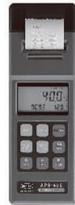
プリンタ付モデル APS-40E