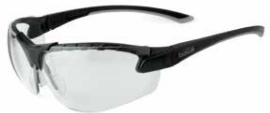
ガスケットなしイメージ